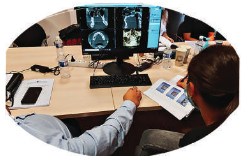
Module 1 Lecture et interprétation radio / Cone beam 3D

Formation reconnue par les sociétés d'assurance pour la pratique de l'implantologie