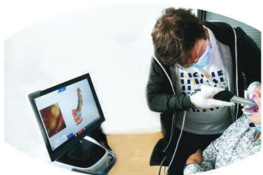
Module 4 TP Empreinte 3D

Formation reconnue par les sociétés d'assurance pour la pratique de l'implantologie