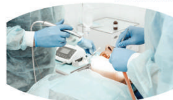
Immersion au bloc

Formation reconnue par les sociétés d'assurance pour la pratique de l'implantologie