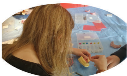
Module 4 TP empreinte sur modèle partiel Pick-Up et Pop-Up